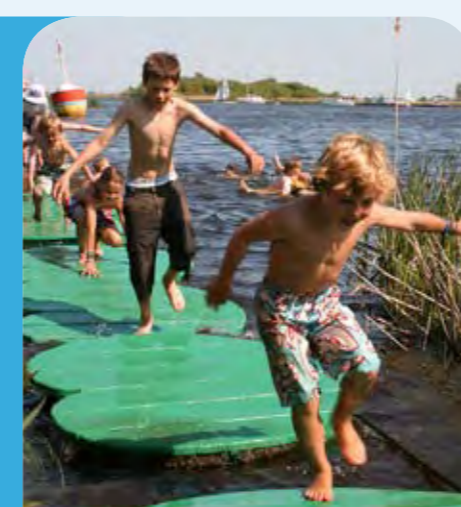
Dolle pret bij Avontureneiland Kameleon Terherne