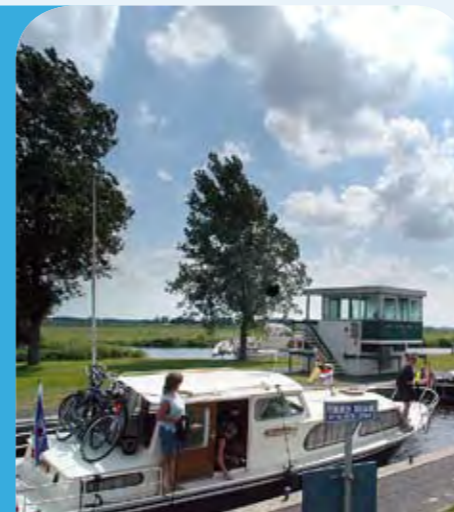
Linthorst Homansluis bij Nijetrijne

Kijk voor meer informatie op www.friesemeren.nl